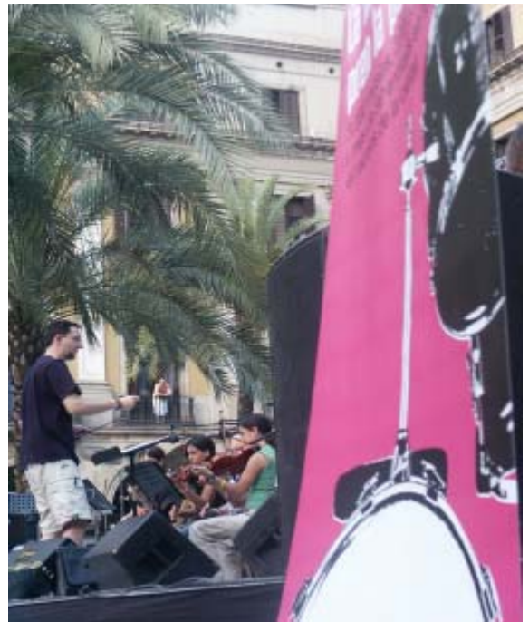
Les escoles de música es van reunir enguany a la Plaça Catedral

A la Plaça Reial, van tenir lloc diverses actuacions de grups d'escoles de música de Catalunya agrupades al voltant d'EMIPAC (Escoles de Música d'Iniciativa privada associades de Catalunya) . Aquest escenari es va concloure amb l'actuació d' Esencia de vida grup proposat per la Plataforma d'Autoeditors, que tornava a participar a La Festa de la Música, com ho havia fet el 2003.