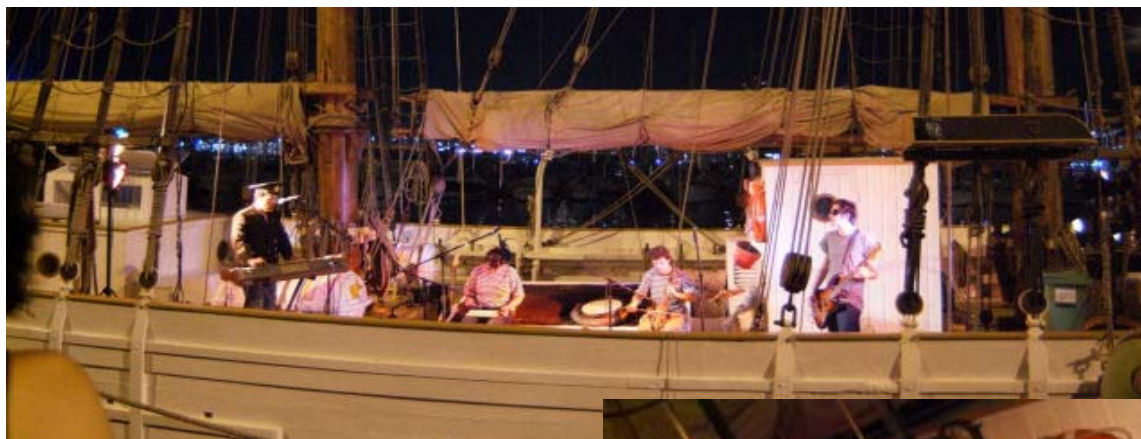
El pailebot Santa Eulàlia es va convertir durant una nit en un escenari molt especial.

Els dos concerts portats a terme per Gràcia Territori Sonor al Pailebot Santa Eulàlia va suposar la recuperació d'un espai habitual en la Festa de la Música de passades edicions. L'orquestra de la Muerte , i Les Sordines van aprofitar un dels espais més originals d'aquesta edició per celebrar dos concerts de gran qualitat. Si bé no es tracta d'un espai on hi càpiga una gran quantitat de públic, cal ressaltar que la producció d'escenaris en xarxa afavoreix una presència del 21 de Juny a tota la ciutat.