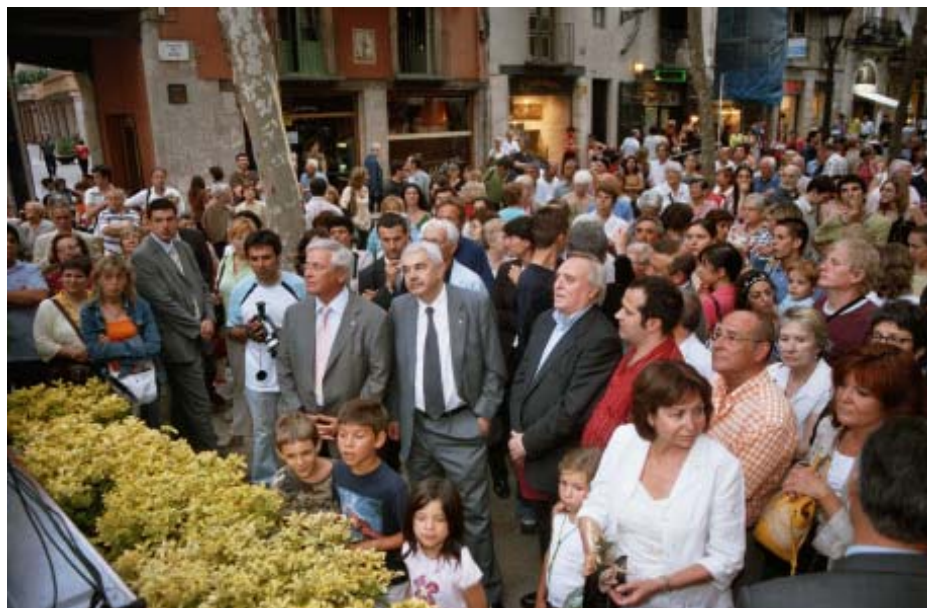
Les autoritats van acompanyar al Mestre Aragall durant l'homenatge ciutadà

Un dels espais on La Festa de la Música es celebra de forma habitual és l' Auditori de Barcelona . En aquest equipament, les col·laboracions entre diverses entitats musicals facilita la participació del públic. Enguany, La Orquestra Universitat de Barcelona , La Coral de l'Ilustre Col·legi d'Avocats , La Schola Cantorum Universitària Barcinonensis , La Coral regina i El Cor de la Demarcació del Barcelonès de la federació Catalana d'entitats Corals van col·laborar en un mateix concert que va resultar un èxit. Cal afegir, que a l'entrada de l'Auditori, es va mostrar un vídeo de presentació del projecte del nou Museu de la Música , que s'afegirà a la celebració del dia 21 de juny en properes edicions.