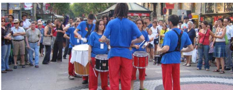
Kabum, els tabalers de Gràcia, van ramblejar davant de milers de persones amb la seva percussió.

Cal destacar, també, les visites guiades que va organitzar l' Associació Catalana de l'Orgue a diverses esglésies de Barcelona. Aquests orgues són difícilment visibles durant l'any, i aquestes visites van permetre la seva difusió al públic, així com posar de relleu la importància d'aquest increïble patrimoni artístic.