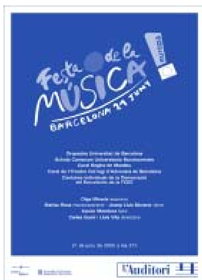
Cartell de l'acte que es va dur a l'Auditori.

Un dels espais on La Festa de la Música es celebra de forma habitual és l' Auditori de Barcelona . En aquest equipament, les col·laboracions entre diverses entitats musicals facilita la participació del públic. Enguany, La Orquestra Universitat de Barcelona , La Coral de l'Ilustre Col·legi d'Avocats , La Schola Cantorum Universitària Barcinonensis , La Coral regina i El Cor de la Demarcació del Barcelonès de la federació Catalana d'entitats Corals van col·laborar en un mateix concert que va resultar un èxit. Cal afegir, que a l'entrada de l'Auditori, es va mostrar un vídeo de presentació del projecte del nou Museu de la Música , que s'afegirà a la celebració del dia 21 de juny en properes edicions.