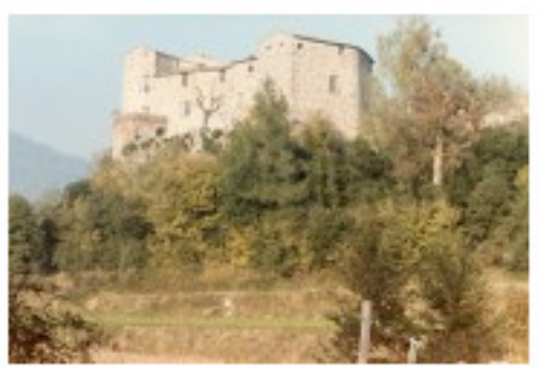
Castell de Sentmenat

Per segona vegada en dos anys, l'Ajuntament de Sentmenat ha tornat a demanar l'abolició dels censos del Marquès de Sentmenat, l'impost de caràcter feudal que encara avui obliga els compradors de determinats immobles a pagar a les hereves del marquès de Sentmenat un suplement del 4% del valor de taxació d'aquests habitatges, vigent des de fa prop de 1000 anys. Paral·lelament, ha sorgit una plataforma ciutadana que lluitarà per l'abolició d'aquest import feudal mitjançant l'organització de diverses activitats reivindicatives..