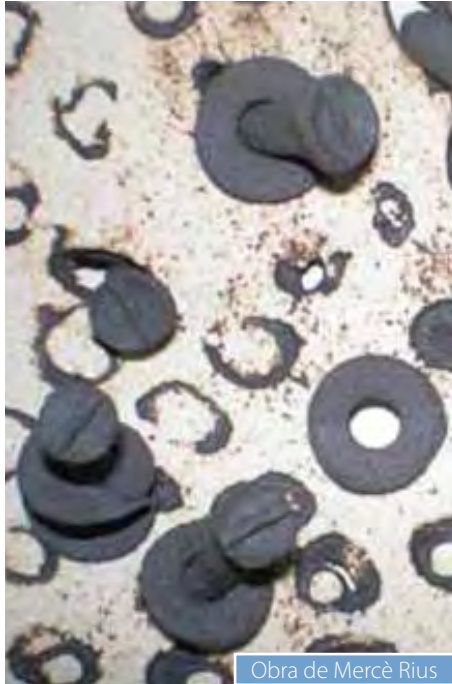
Obra de Mercè Rius

Durant el mes de juliol s'ha pogut veure l'exposició de pintures a l'oli de l'artista Albert Navarro.