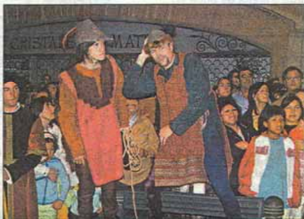
La cervilla medieval de divendres a la nit va ser un èxit.