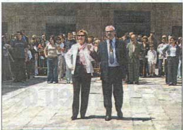
L'alcalde, Joan Amézaga, va obrir el tradicional Ball de l'Eixida.