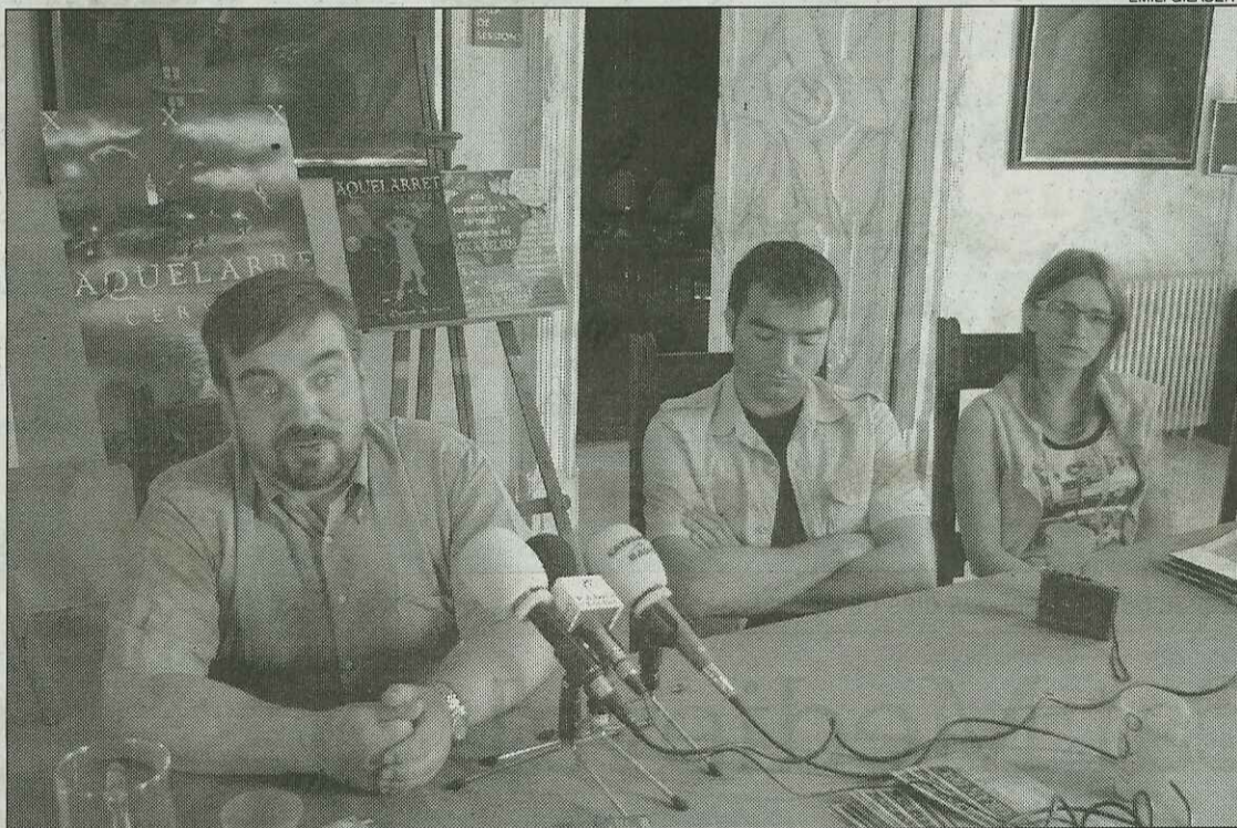
Una cinquantena de persones participen en l'elaboració dels tallers de l'Aquelarre.