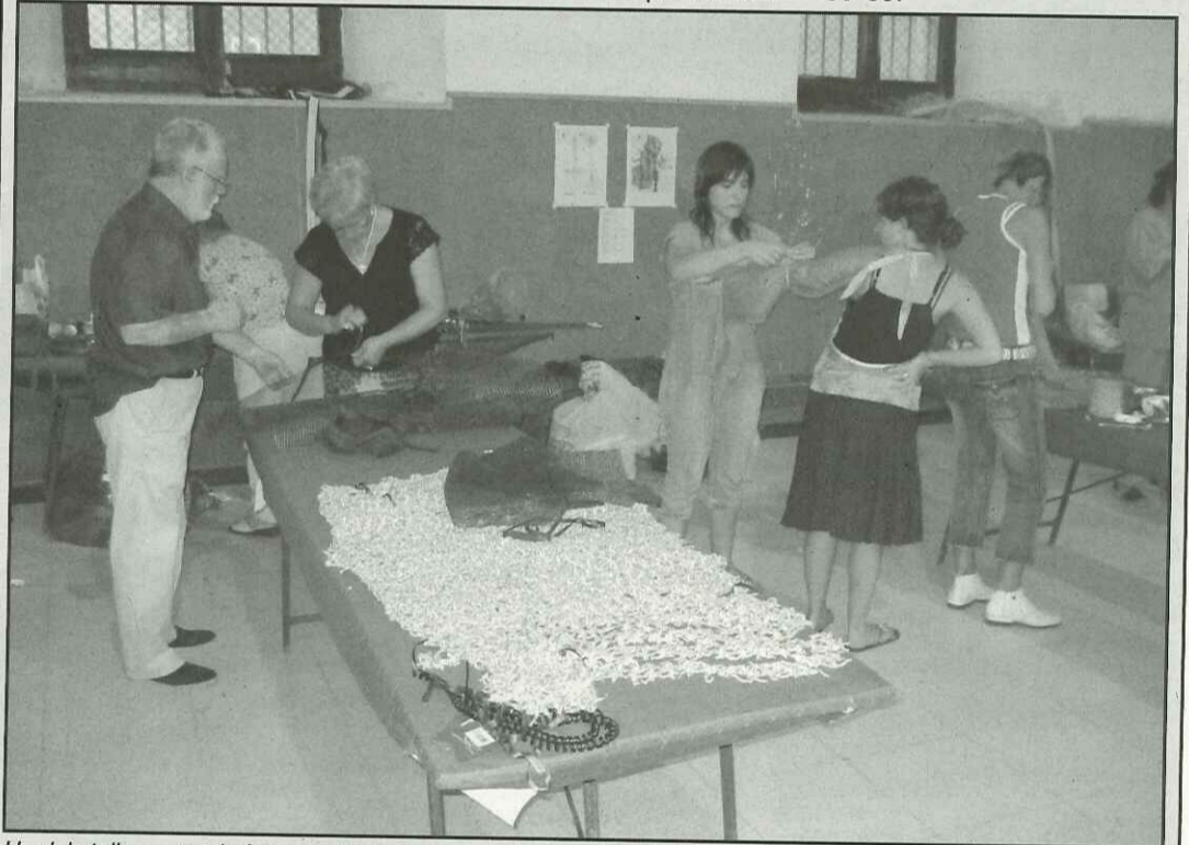
Un dels tallers per a la festa realitzats l'any passat per a l'Aquelarre

Cal dir que els tallers, en els que l'any passat van participar-hi prop d'un centenar de persones, són oberts a tots els majors de 16 anys, però cal apuntar-se prèviament a l'activitat. Les inscripcions, totalment gratuïtes, es podran formalitzar entre el 23 de juliol i el 3 d'agost, a la Regidoria de Festes de la Paeria o bé trucant al telèfon 973 53 30 09.