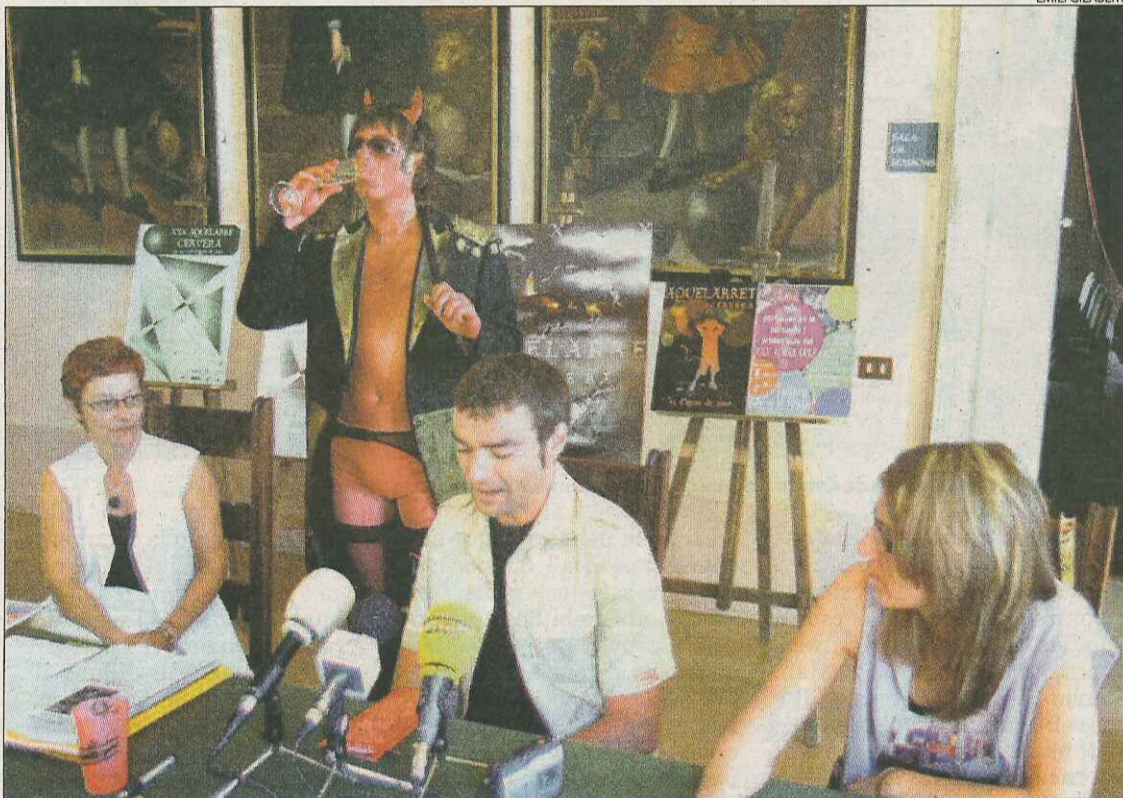
L'ambient festiu ja es va deixar notar ahir a la presentació de l'Aquelarre a l'ajuntament de Cervera.