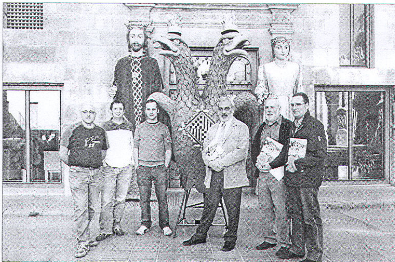
Imatge de la presentació de l'àguila bicéfala que s'estrenarà a les festes de Tàrrrega.

el patrimoni de Tàrrrega se celebrarà demà amb la cercavila nocturna que recorrerà els principals vestigis de la història de la ciutat.