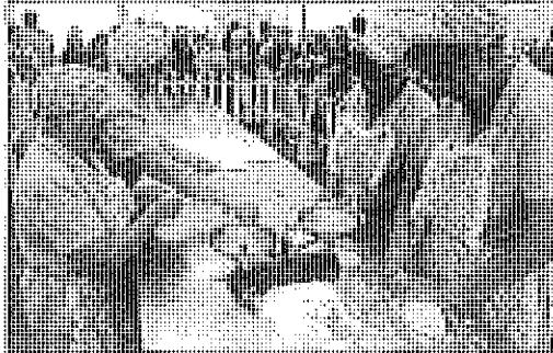
El passeig La Caixa amb molts de menuts durant la inauguració de la fira.