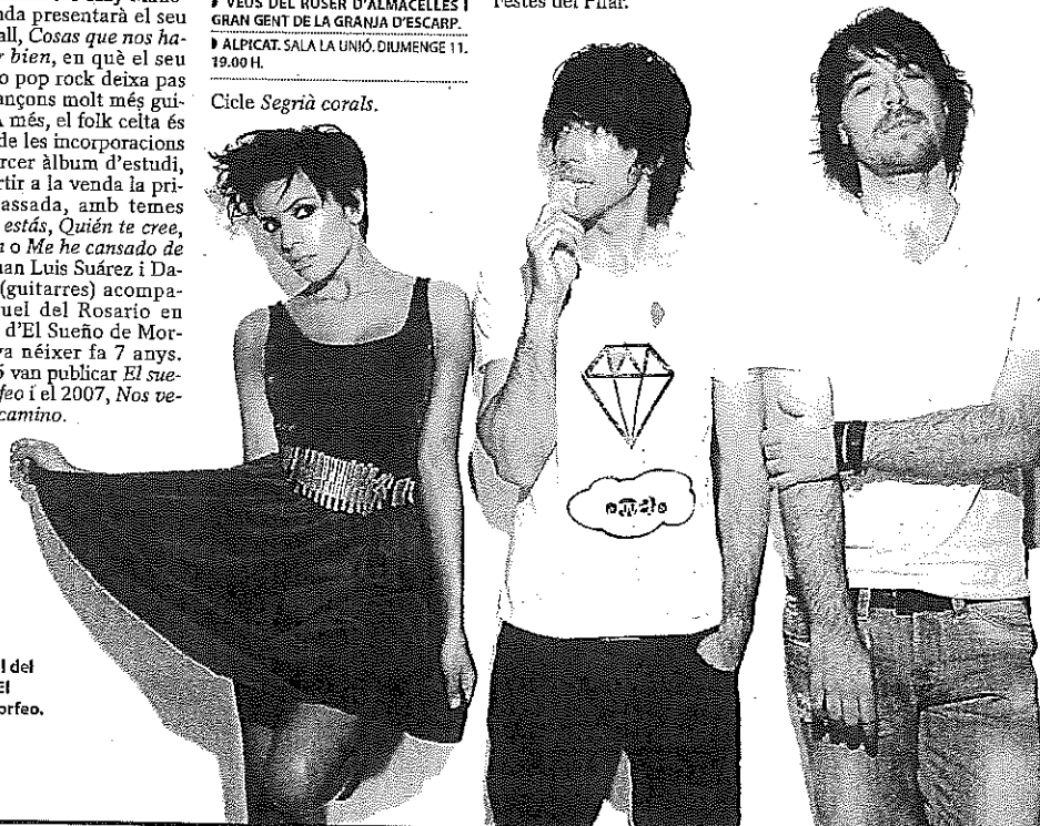
Imatge promocional del trio asturià El Sueño de Morfeo.