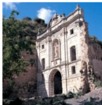
Cartoixa d'Escaladei canalpatrimoni.com

A la Morera de Montsant, a les 7 de la tarda, és prevista la primera ballada pública de la Jota de la Morera, el ball tradicional del poble que s'ha recuperat recentment. De dos quarts de 6 a dos quarts de 7 de la tarda es farà un taller d'aquesta dansa i tot seguit un berenar de pa amb vi i sucre.